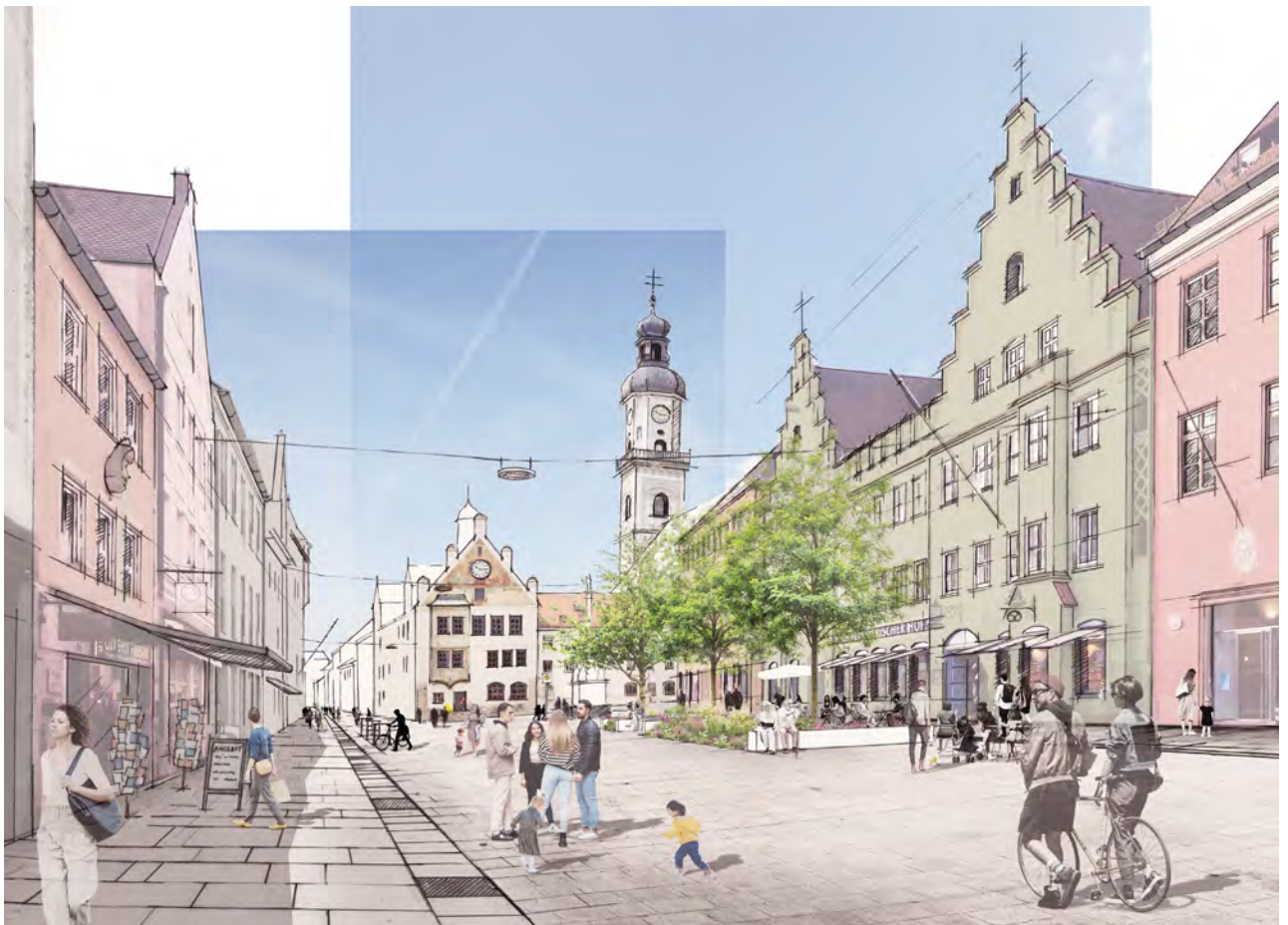
PERSPEKTIVE DER PLANUNGEN IN DER UNTEREN HAUPTSTRASSE MIT PFLANZINSELN UND BAUMSTANDORTEN

direkter link zur Infoseite: innenstadt.freising.de