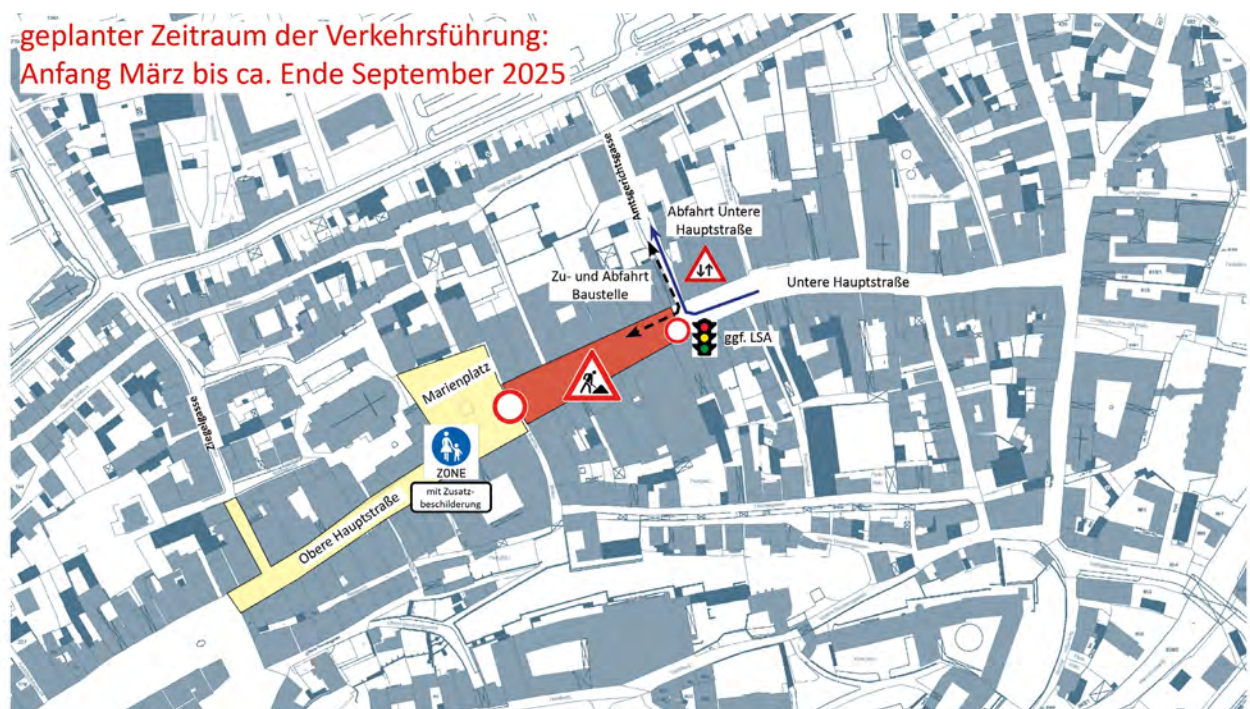
SCHEMATISCHE DARSTELLUNG DER GEPLANTEN VERKEHRSFÜHRUNG IM BEREICH UNTERE HAUPTSTRASSE ZU BEGINN DER MASSNAHME. ES GILT DIE TATSÄCHLICHE BESCHILDERUNG UND STVO.

• Der zentrale Bereich der Fußgängerzone vom Schiedereck bis zum Marienplatz ist dann zu den angegebenen Lieferzeiten nur über das Schiedereck/Obere Hauptstraße anfahrbar. Bitte beachten Sie, dass diese Zufahrt während der Marktzeiten mittwochs und samstags nicht möglich ist!