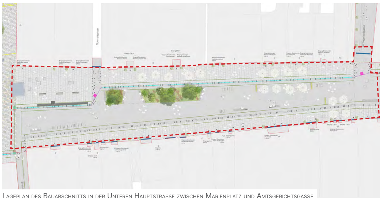
LAGEPLAN DES BAUABSCHNITTS IN DER UNTEREN HAUPTSTRASSE ZWISCHEN MARIENPLATZ UND AMTSGERICHTSGASSE

Diese Maßnahmen werden voraussichtlich bis Ende des Jahres 2025 andauern.